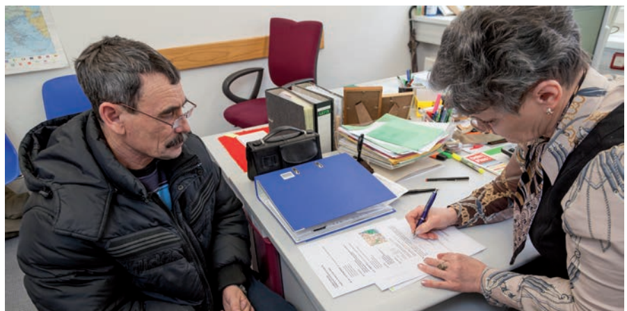
Spätaussiedler aus Russland in der Beratung des DRK Suchdienstes im Aufnahmelager Friedland.

Ansprechpartner im Kreisverband Schwalm-Eder: Heike Hohm-Fiehler 0 66 91/94 63 17 hohm-fiehler@drk-schwalm-eder.de