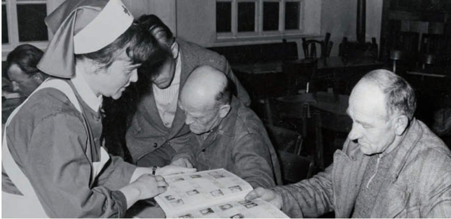
Heimkehrer aus der Sowjetunion suchen nach dem Zweiten Weltkrieg im Lager Friedland nach Angehörigen.

Am Ende des Zweiten Weltkriegs gab es kaum eine Familie, die nicht nach Vater, Sohn, Bruder oder einem anderen Angehörigen suchte. Um die Schicksale der Vermissten zu klären, wurde 1945 der DRK Suchdienst gegründet. 1950 hatte die Bundesregierung dazu aufgerufen, alle bis dahin noch Vermissten zu melden. Von 2,5 Millionen Fällen konnte der Suchdienst fast die Hälfte klären.