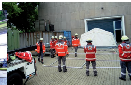
Einsatz in Dresden