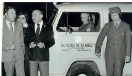
Indienststellung des ersten eigenen Einsatzwagens 1973.