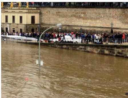
Die Elbe in Dresden.

mitteln, Hygieneartikeln und anderen Dingen des täglichen Bedarfs. Zudem stellte der DRK-Bundesverband Hunderte von Bautrocknern für die Zeit nach der Flut zur Verfügung.