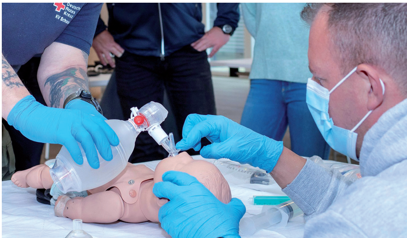
Teilnehmer*innen führen in einer Gruppenaufgabe Reanimationsmaßnahmen an einem Säugling durch.