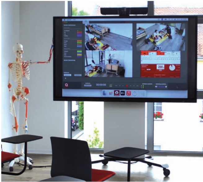
Im benachbarten Klassenraum kann das Geschehen am Bildschirm verfolgt und besprochen werden.

Kameras zeichnen jeden Handgriff der Rettungsdienstler auf, so dass die Handlungen jederzeit besprochen werden können. Auf der dazugehörigen Dachterrasse soll ab März 2022 ein Simulations-Rettungswagen – hessenweit einzigartig - aufgebaut werden. Damit können die Auszubildenden den Einsatz im Fachpraxisraum bis zur simulierten Übergabe im Krankenhaus fortführen.